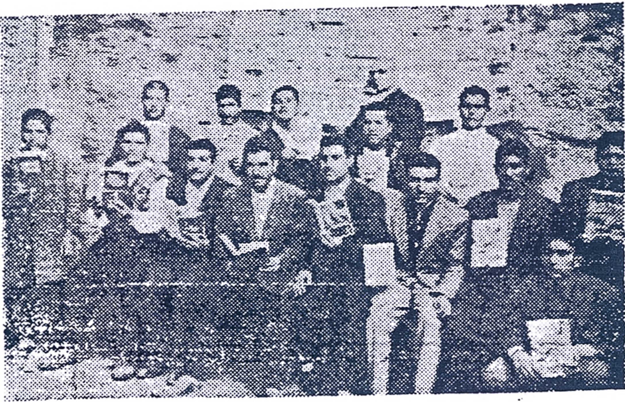
Gaziantep Ceza ve Tevkif Evinde Kültür Derneğinin bağışladığı yayımları okuyan mevkuf ve mahkûmlar