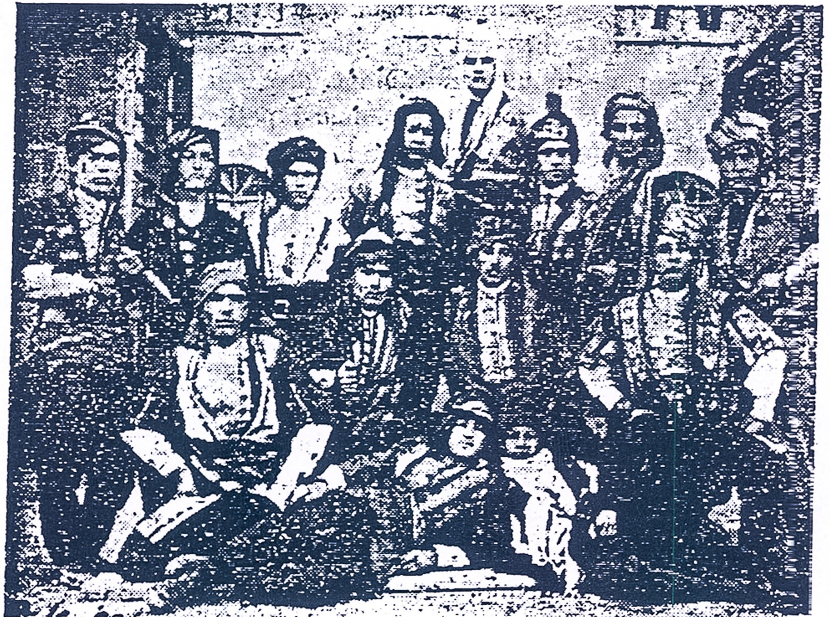
Eski Gaziantep Halkewinde vazife alan ve millî kıyafetler giymiş Gaziantep'li gençler. Gaziantep Kültür Derneği Halkewinin bıraktığı boşluğu doldurmaya çalışmaktadır.